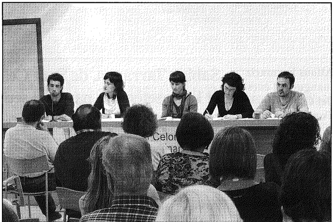
La CUP celebra en obert les Assemblees, on poden participar simpatitzants i votants

Durant l'assemblea també es presentarà i debatrà el pla de treball de la CUP per als propers mesos. Fins a la data, la formació ha celebrat en obert les assemblees convocades, de manera que les persones que se sentin afins a la CUP puguin assistir-hi, intervenir-hi i votar. En aquesta ocasió l'acte també serà obert i podran participar-hi en igualtat de drets totes les persones que siguin votants o simpatitzants de la formació independentista.