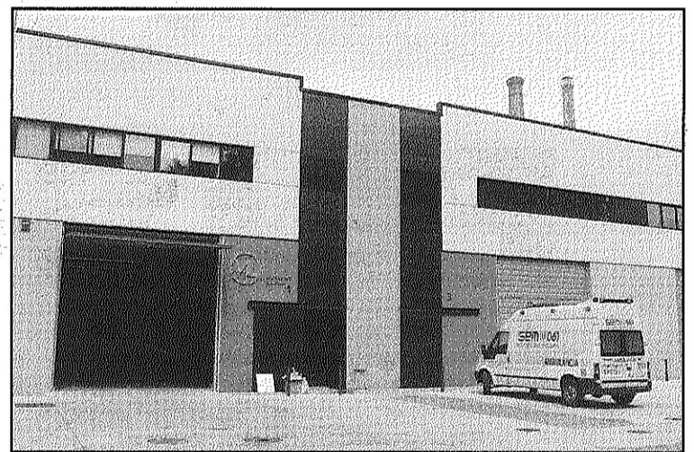
La nova nau que inaugura avui el SEM al polígon