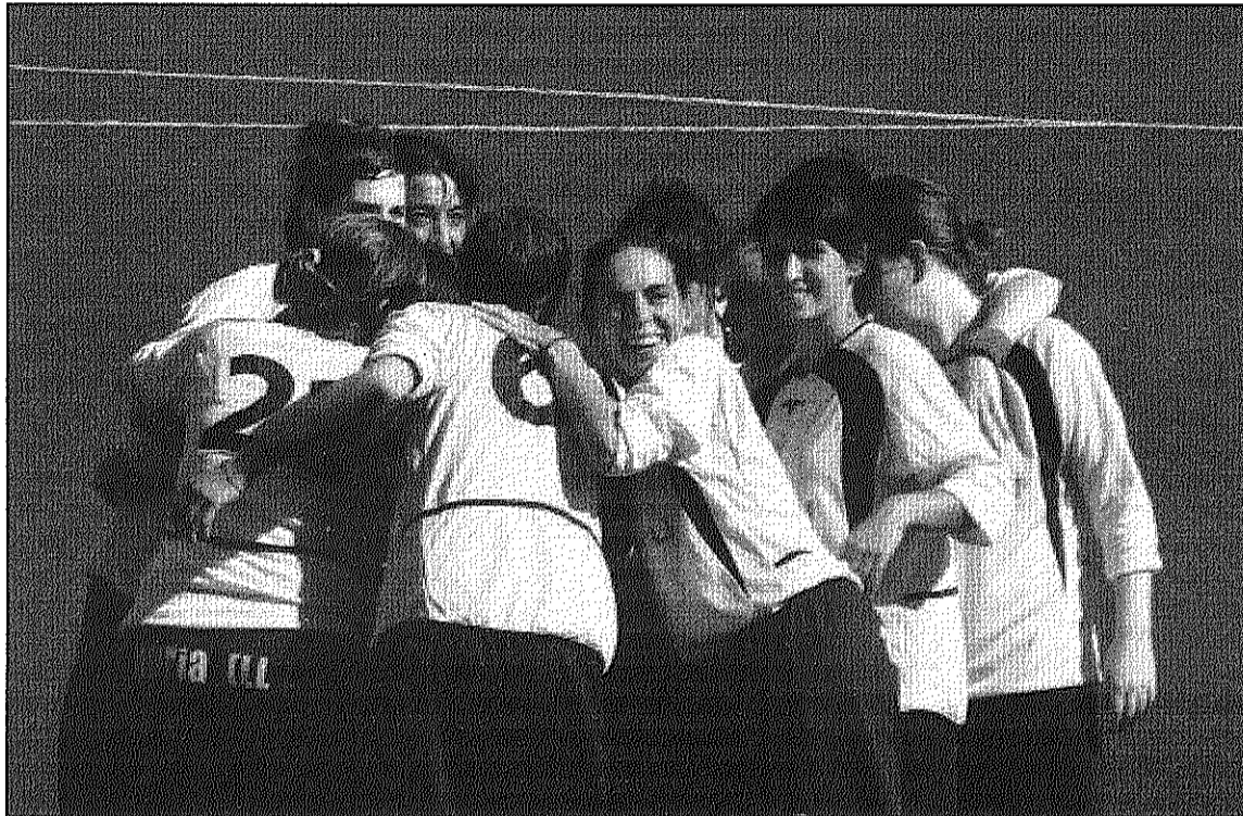
El CF Palautordera femení va jugar un amistós de pretemporada al camp del Vic (L'AdBM)

La tarda de diumenge serà la presentació oficial dels primers equips masculí i femení al III Torneig d'Estiu. Aquest s'obrirà a les 5 amb el partit entre el CF Palautordera femení i la UE la Plana. A les 7 de la tarda, el pri-