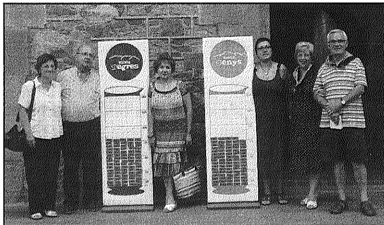
Una imatge del resultat de l'acapte de divendres i dissabte

REDACCIÓ. Sant Celoni Un total de 242 persones van participar, el passat cap de setmana, a l'acapte de sang organitzat a Can Ramis per l'Associació de Donants de Sang, amb el suport de la Creu Roja de Sant Celoni. La convocatòria, que s'inscrivía en la competició de Festa Major del Corremonts entre MontSenys