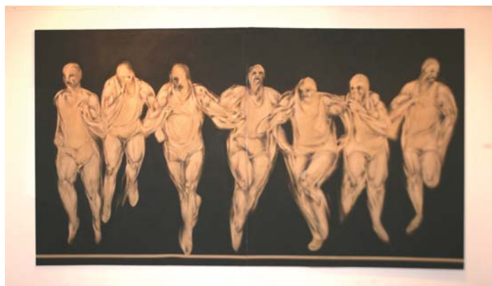
Una de les pintures que es van exposar