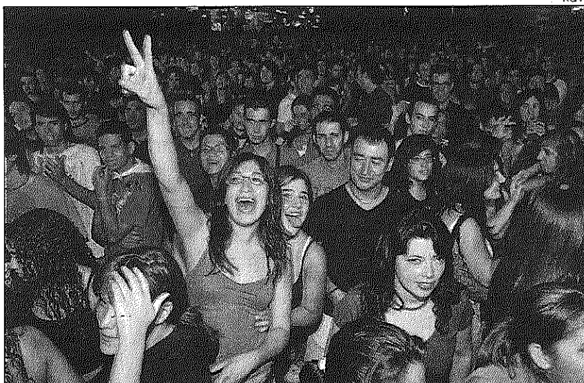
La noche, en la Festa Major, confunde a muchos.

El consumo de alcohol no es la seña de identidad de la Festa Major dels blancs i blaus , y eso la distingue, porque uno puede disfrutarla sin tener que ir con una 'taja'. Sin embargo, ocurría que en la Nit Golfa los 'tajas' no eran excepción, sino legión y tiene su por qué: A partir de las seis de la mañana no hay cuerpo que aguante de forma