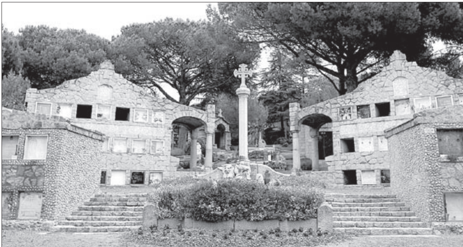
La construcció dels nínxols o els acabats en forja són algun dels elements que converteixen el cementiri de Cardedeu en una obra única del modernisme