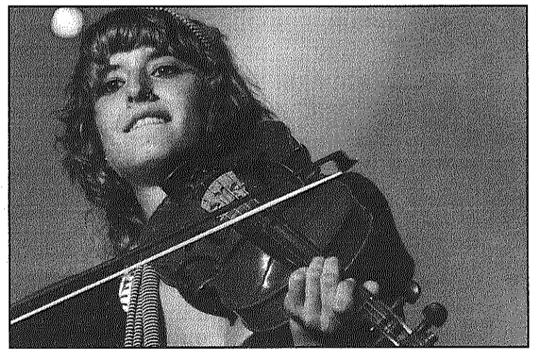
Qui hi ha? oferirà dijous vinent un concert a la Rectoria