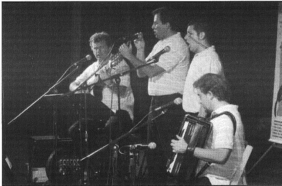
Rems protagonitzarà una cantada d'havaneres el 24 d'agost a la plaça de la Vila (L'AdBM)

Dissabte, a les 8 de la tarda, l'església parroquial de Montseny acollirà la missa vespertina. La plaça de la Vila s'omplirà a partir