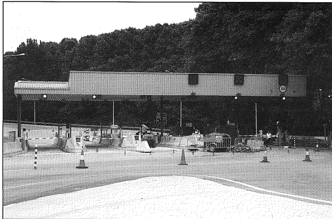
L'Estat havia bonificat Acesa amb un 95 per cent de l'IBI (L'AdBM)

El Tribunal Superior de Justícia de Madrid dona la raó als Consistoris