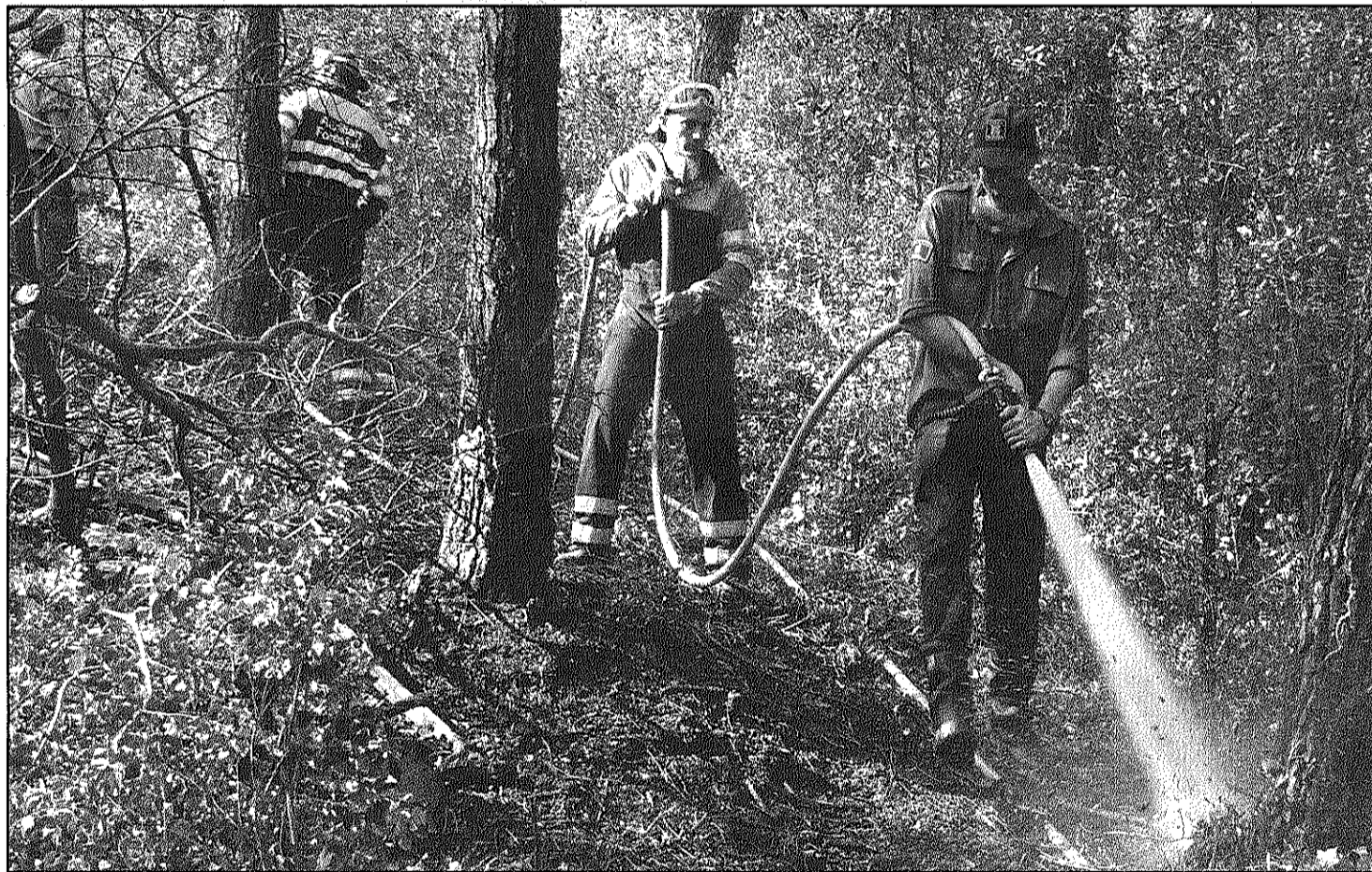
Els Bombers treballant dilluns en l'incendi que es va produir al costat d'un camí de la zona de Can Riera de l'Aigua

Mossos i Policia Local investiguen la relació entre els incendis i la possible autoria dels sinistres (Pàgina 3)