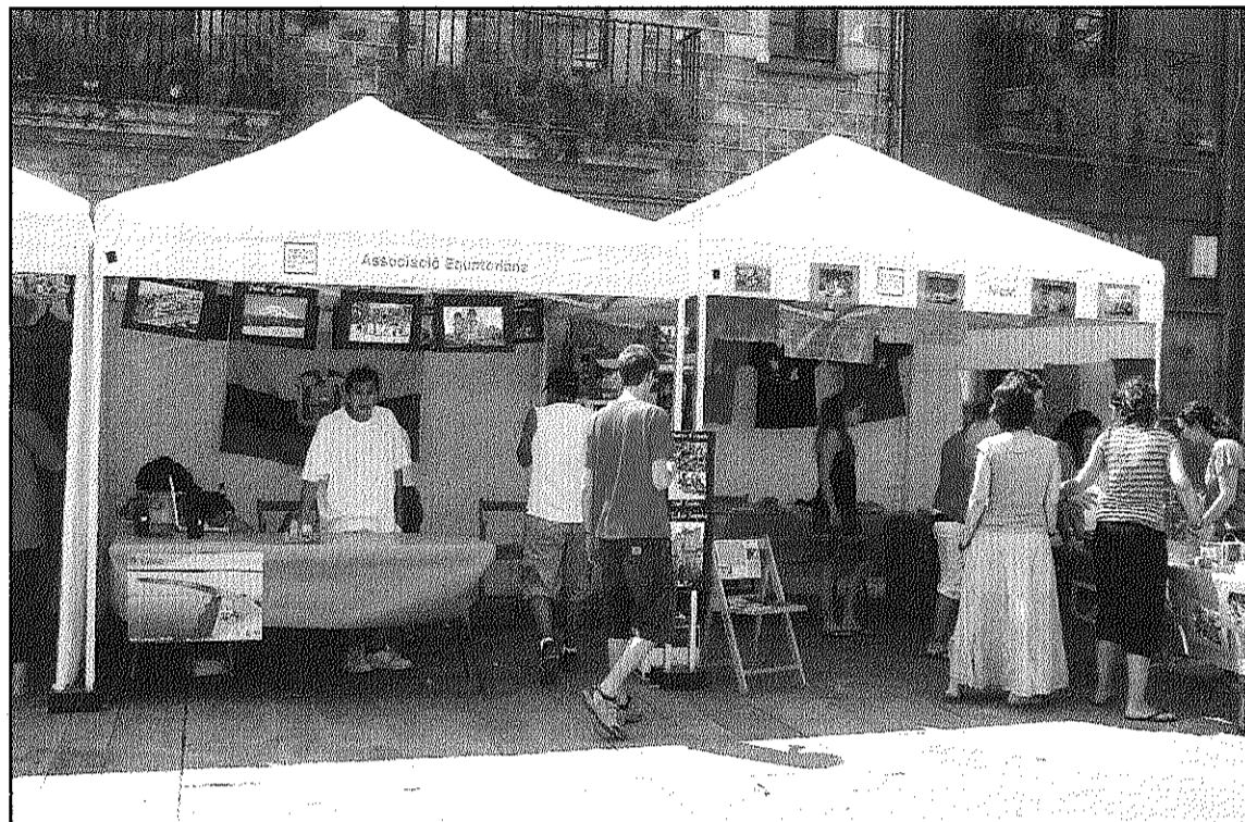
La primera edició de la Mostra d'Entitats tanca amb una bona valoració dels participants (L'AdBM)

Fins a 45 entitats van oferir una mostra de les seves activitats al centre de la Vila