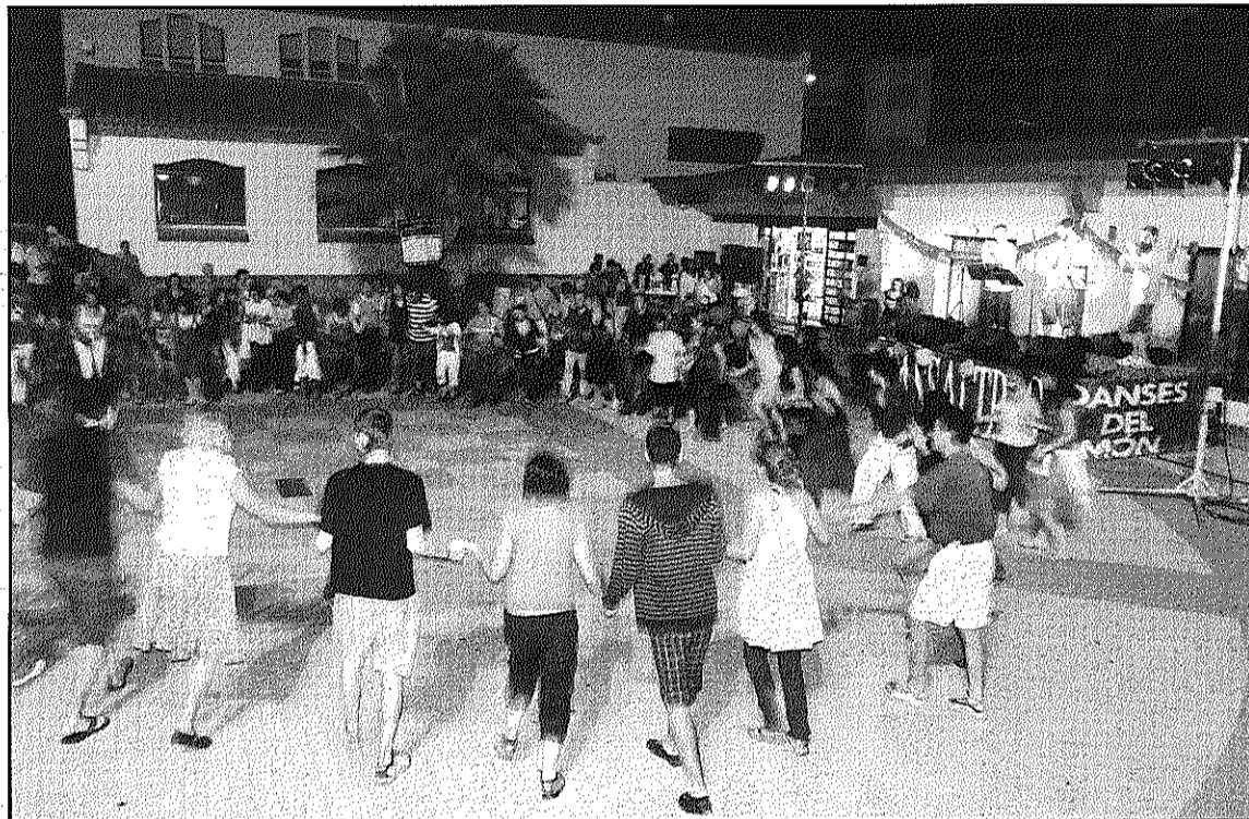
Una imatge del ball amb el grup Mirabèl a la plaça de la Biblioteca la nit de dissabte

Els membres de Sant Celoni de l'Associació van seleccionar, per al Sarau, els balls 'André Retourné' de Bretanya, 'Sumadinka' i 'Kolo srem' de Sèrbia i 'Raka raka' i 'Sabrali mise' de Bulgària. Els de la Garriga