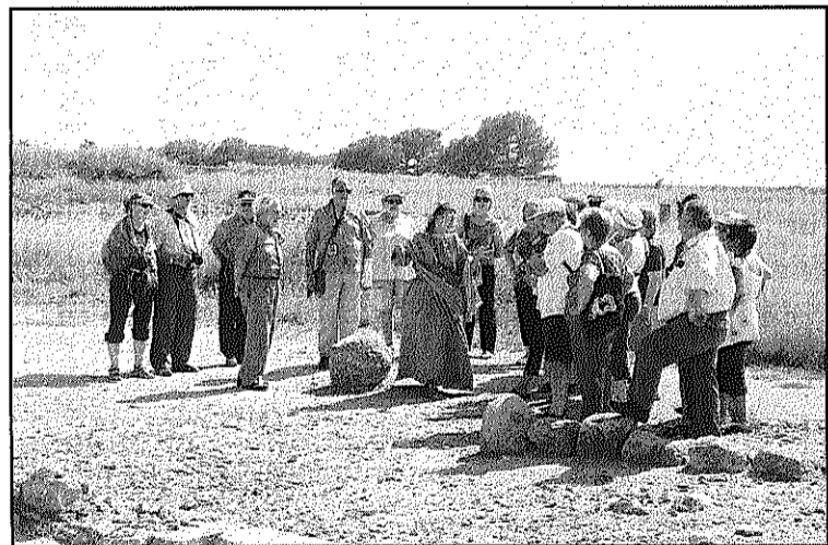
Participants a la Sortida Cultural durant la visita guiada

REDACCIÓ. Sant Celoni Unes 60 persones van participar, dissabte passat, a la Sortida cultural organitzada per l'Ajuntament de Sant Celoni a Castelló d'Empúries i al jaciment grec i romà d'Empúries. Els participants van poder visitar la ciutat medieval de Castelló d'Empúries, que va ser capital del comtat d'Empúries des del segle XI, la basílica gòtica de Santa Maria i la portalada de l'església, amb escultures dels apòstols i l'adoració dels reis, i el retaule major d'alabastre. La visita va continuar per l'edifici gòtic civil de la llotja, la presó medieval, restaurada fa poc temps, el call