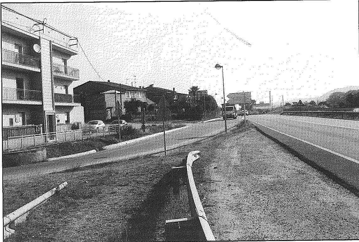
El ramal d'accés al carrer Dr. Trueta es tallarà dilluns pels cotxes procedents d'Hostalric (L'AdBM)

Després de nombrosos mesos d'aturada, a finals de juliol s'han començat a veure els primers moviments per reprendre la cons-