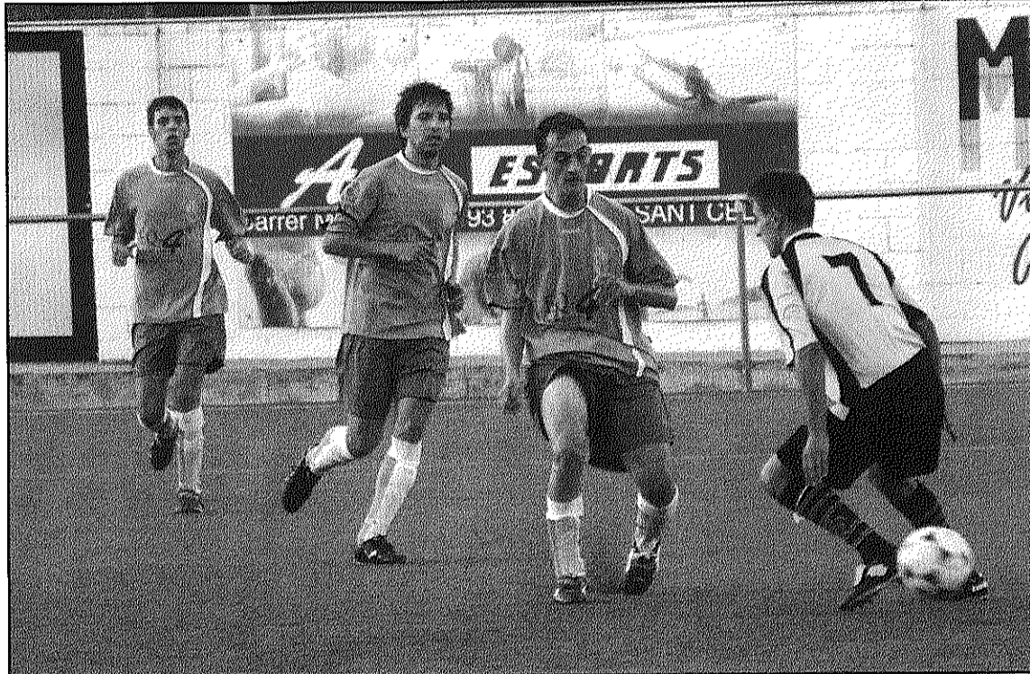
La UD Pitres es desvincula com a equip filial del CE Sant Celoni per la propera temporada (L'AdBM)

Per la seva banda, el CE Sant Celoni manté la seva intenció de tenir un segon conjunt i té inscrit a la federació un CE Sant Celoni B, que si no hi ha canvis jugarà