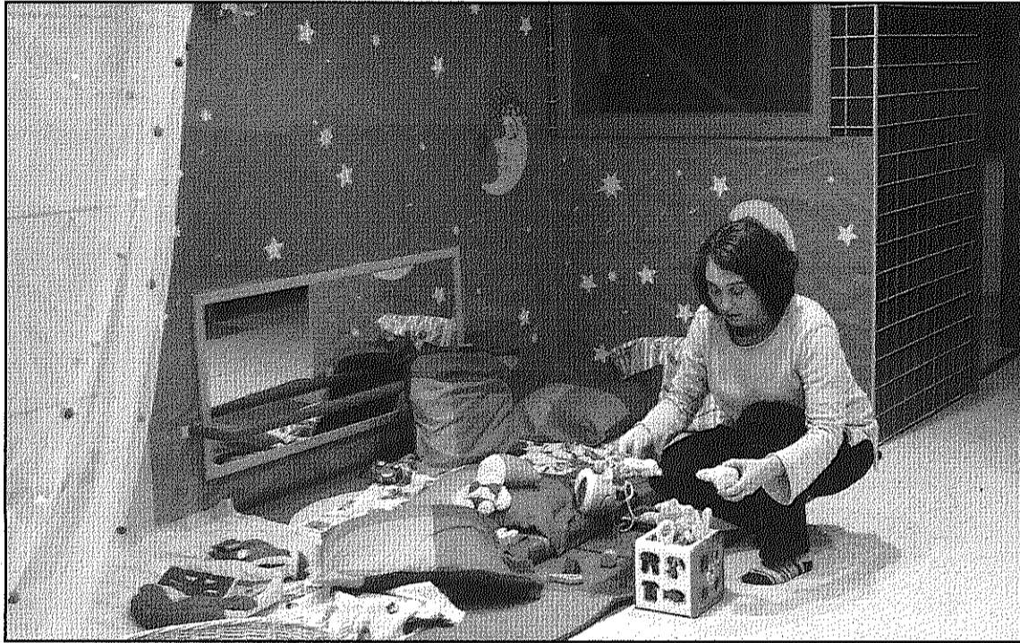
El PSC demana que es busquin alternatives als 60 infants que no tenen plaça al Blauet (L'AdBM)

"Des del PSC considerem que el fet de quedar-se 60 nens i nenes sense aquest servei", assenyala la formació, és un problema greu per al municipi i per les famílies afectades, "ja que estem passant uns moments difícils i les famílies necessiten tot el nostre suport". En aquest sentit, el PSC es va reunir, el passat 9 de juliol, amb la direcció de l'Escola Pascual que els va posar de manifest que, malgrat 60 infants havien quedat fora del Blauet, ells comptaven amb un total de 127 places autoritzades i només havien matriculat 37