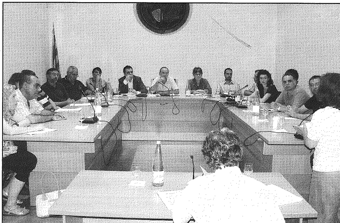
Una imatge del Ple celebrat aquest dimecres que va aprovar el model educatiu 3-16

L'alcalde va assenyalar que en aquesta matèria "és important treballar d'una manera planificada" per marcar l'escenari de futur i establir el calendari d'actuacions que l'han de permetre fer efectiu. "Caldrà que el Departament d'Educació hi doni recolzament amb recursos econòmics per fer les obres necessàries", va assenyalar, recordant el compromís adquirit pel Conseller Ernest Maragall amb els directors dels centres educatius de Sant Celoni de fer al municipi una prova pilot d'aquest model formatiu continu dels 3 als 16 anys. Aquest nou model hauria de comportar també, segons Deulofeu, un reforçament de l'IES amb un increment de les