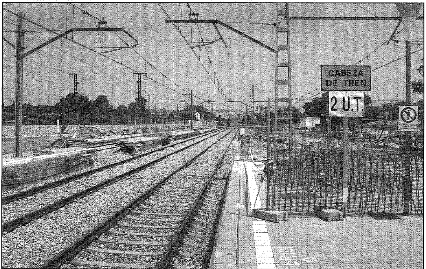
L'estació de Riells aquest dimecres, sense cap mena d'informació als usuaris durant les obres que fa Renfe (L'AdBM)

Els usuaris es queixen dels entrebancs per arribar a l'andana i de la manca de senyalització de Renfe (Pàgina 14)