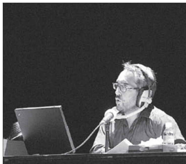
Pep Miràs va resultar insegur i massa dubitatiu en el seu paper de locutor

Si bé és evident que el text de Guix vol precisament jugar amb el contrast entre la pesada i inconsistent xerrameca del pseudocientífic locutor de ràdio i l'atractiu