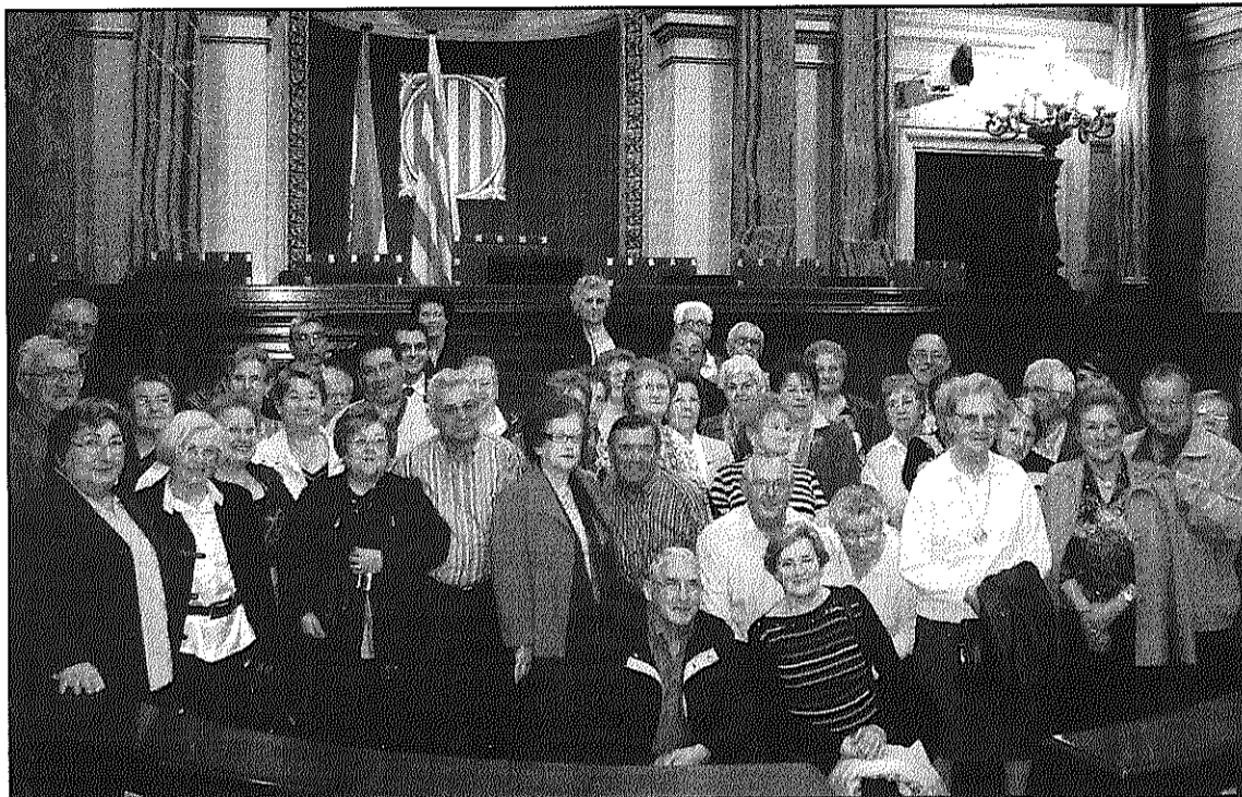
Diversos membres de l'Esplai de Sant Celoni van fer una visita al Parlament de Catalunya