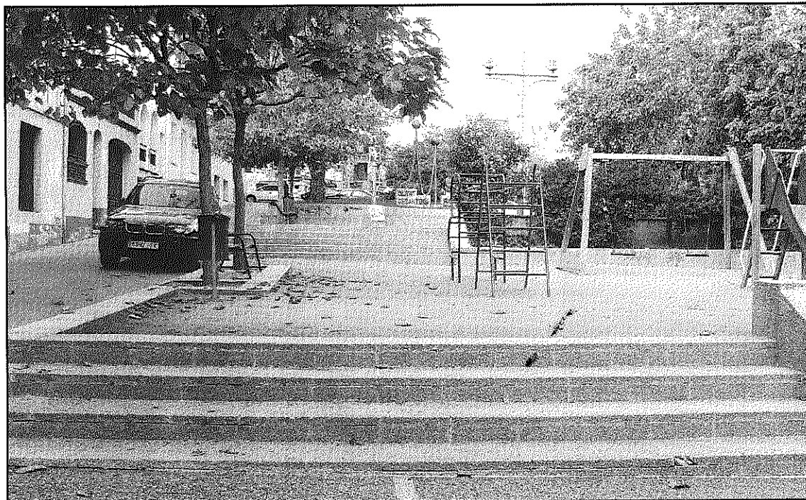
També preveu substituir jocs malmesos a altres espais, com la plaça Comte del Montseny