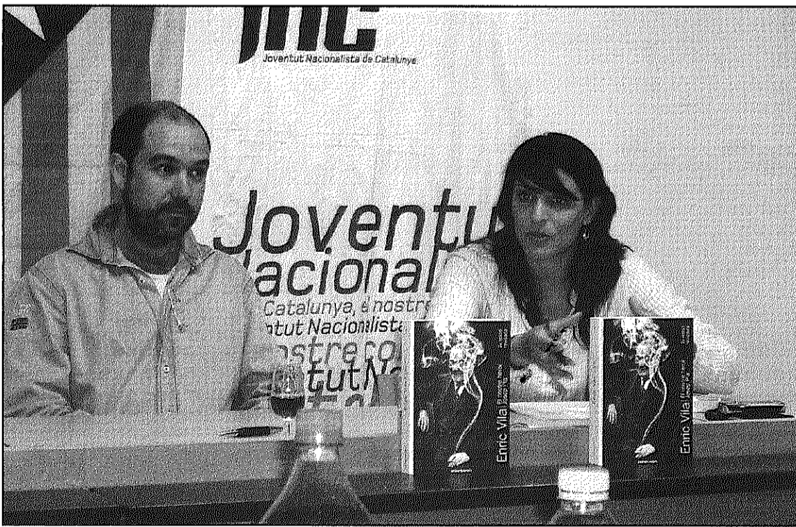
Una imatge de la presentació del llibre de Vila a la Biblioteca de Sant Celoni

L'autor va aprofitar per destacar que els escriptors i les escriptores