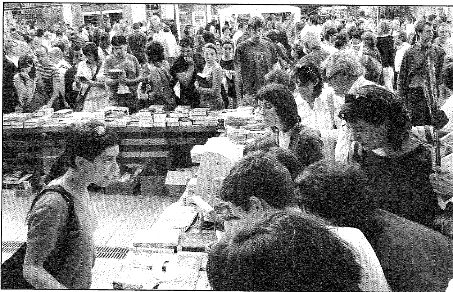
Malgrat al migdia els pronòstics no eren gaire bons, a la tarda els carrers es van omplir de gent aprofitant el bon temps (L'AdBM)

Centenars de persones compren llibres i roses a les parades de carrer i a les llibreries de tota la comarca (Pàgina 7)