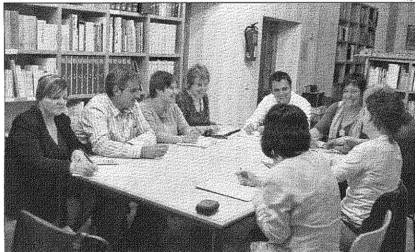
Los ayuntamiento del Baix Montseny quieren seguir incrementando los servicios compartidos

Entre los proyectos planteados se encuentran dos actividades musicales: el concurso Sant Celoni Sona, en el cual podrán participar todos los grupos de música amateurs o semiprofesionales