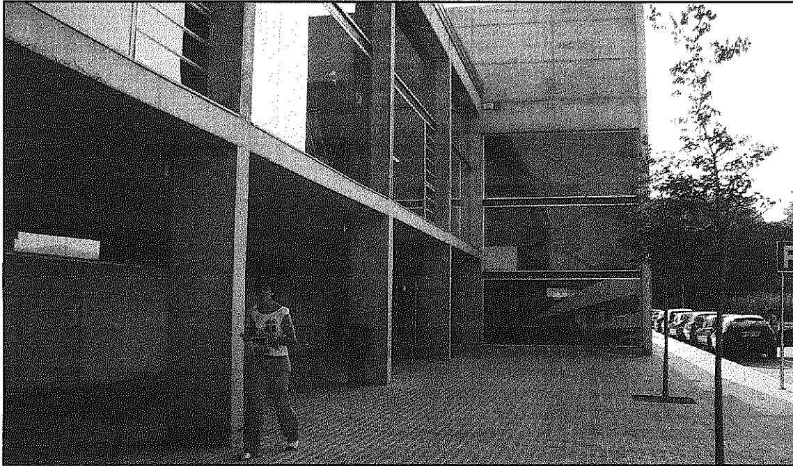
L'actual complex esportiu del Sot de les Granotes s'ampliarà amb un nou pavelló annex (L'AdBM)

Els treballs, al marge de la construcció d'una pista poliesportiva coberta de 22 per 45 metres, contemplen també l'ampliació de l'actual edifici del Centre Municipal d'Esports, al que s'afegirà un cos a la banda oesta amb