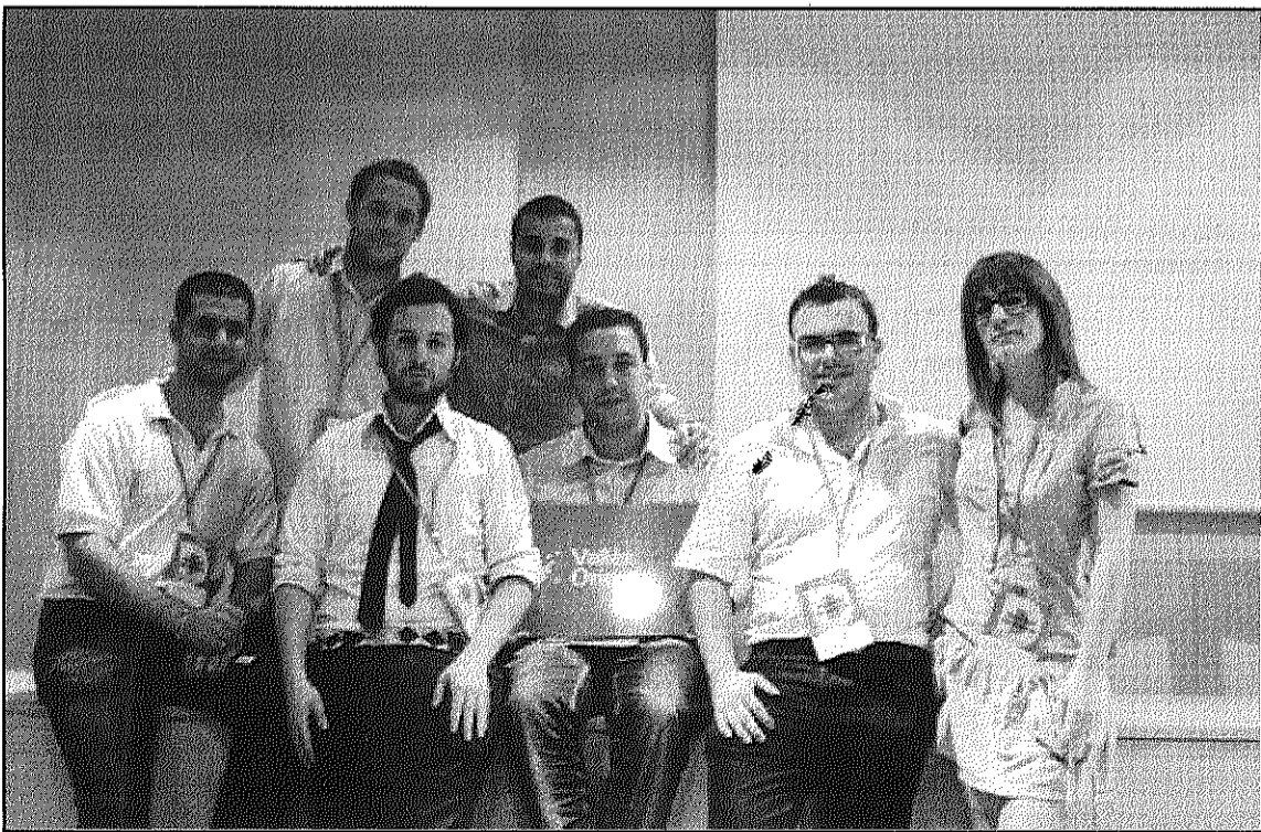
La nova executiva de les JSC escollida en Congrés el passat cap de setmana