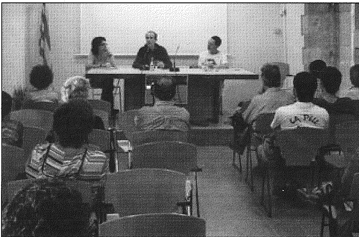
Una imatge de la primera conferència sobre planificació del territori i espais naturals (L'AdBM)

Les jornades de la formació continuen aquest cap de setmana amb la conferència entorn a 'Urbanisme i gestió del territori', dissabte, a dos quarts de 8 del vespre a la sala d'actes de la Rectoria Vella. La xerrada anirà a