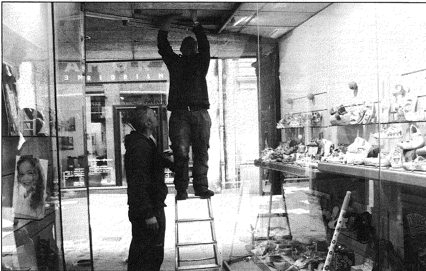
La majoria dels robatoris a establiments comercials d'aquestes setmanes al Baix Montseny s'han produït durant la nit

Una desena d'establiments d'Arbúcies, Sant Celoni i Vallgorguina afectats durant la darrera setmana (Pàgina 7)