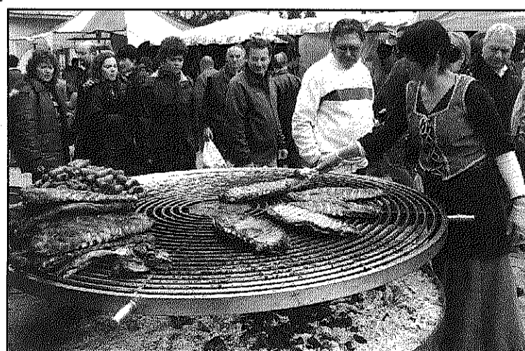
Centenars de visitants es van passejar entre les parades (L'AdBM)

La Fira Medieval d'Hostalric s'omple d'assistents malgrat el temps (Pàgina 29)