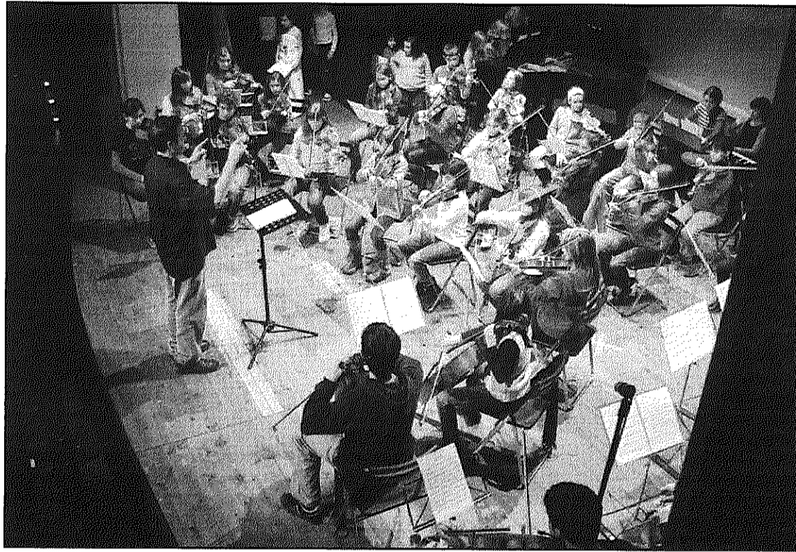
L'Ajuntament aprova bonificacions per a l'alumnat del Centre Municipal d'Expressió (L'AdBM)

També es podran beneficiar dels ajuts els que tinguin més d'un fill apuntat