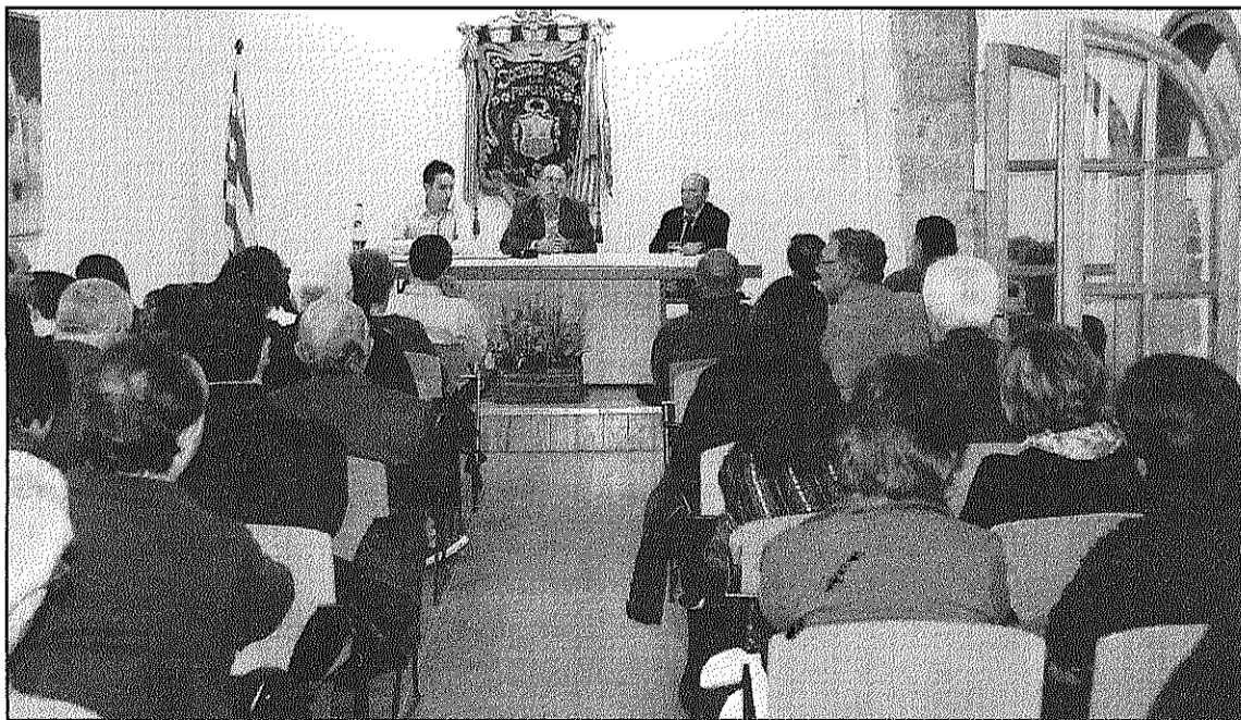
Una imatge de la presentació del llibre 'El Centre Popular a Sant Celoni' a la Rectoria Vella

Diumenge la Biblioteca de l'Escorxador acull la presentació de 'La vall de Fuirosos'