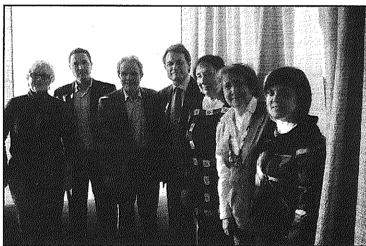
Representants d'entitats socials celonines amb Artur Mas

REDACCIÓ. Sant Celoni Durant la seva visita pel Baix Montseny, el Maresme i el Vallès Oriental, el líder de CiU, Artur Mas, es va reunir divendres de la setmana passada amb diverses entitats de caire social i sindical amb un dinar a l'Hotel Augusta, de Vilanova del Vallès. Entre les