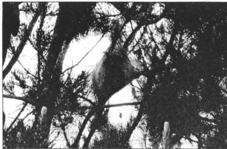
Una bossa que indica la presència de la processionària als pins del Baix Montseny (L'ADBM)

La plaga ha afectat, de manera punyent, els municipis de Fogars de la Selva, Hostalric, Massanes, Arbúcies i Sant Feliu de Buixalleu. Algunes d'aquestes poblacions, com Hostalric i Fogars, s'han adreçat al Departament de Medi Ambient per demanar que se'ls consideri com a zona afectada per la plaga i, per tant, com a municipi preferent a tractar per reduir