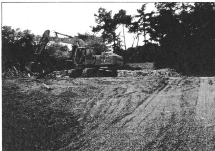
La llar d'infants es farà als terrenys on hi havia la piscina descoberta (L'AdBM)

Des del mes de desembre, i sota la campanya "Un nou Sant Celoni comença a caminar", la CUP està treballant en la preparació del que serà el seu programa electoral després que va fer pública la voluntat de concórrer a les properes eleccions municipals del 27 de maig. Durant aquest temps, la CUP ha fet consultes populars i ha organitzat els anomenats "berenars tertúlia" perquè entitats i associacions o persones a títol individual participessin en l'elaboració del programa electoral.