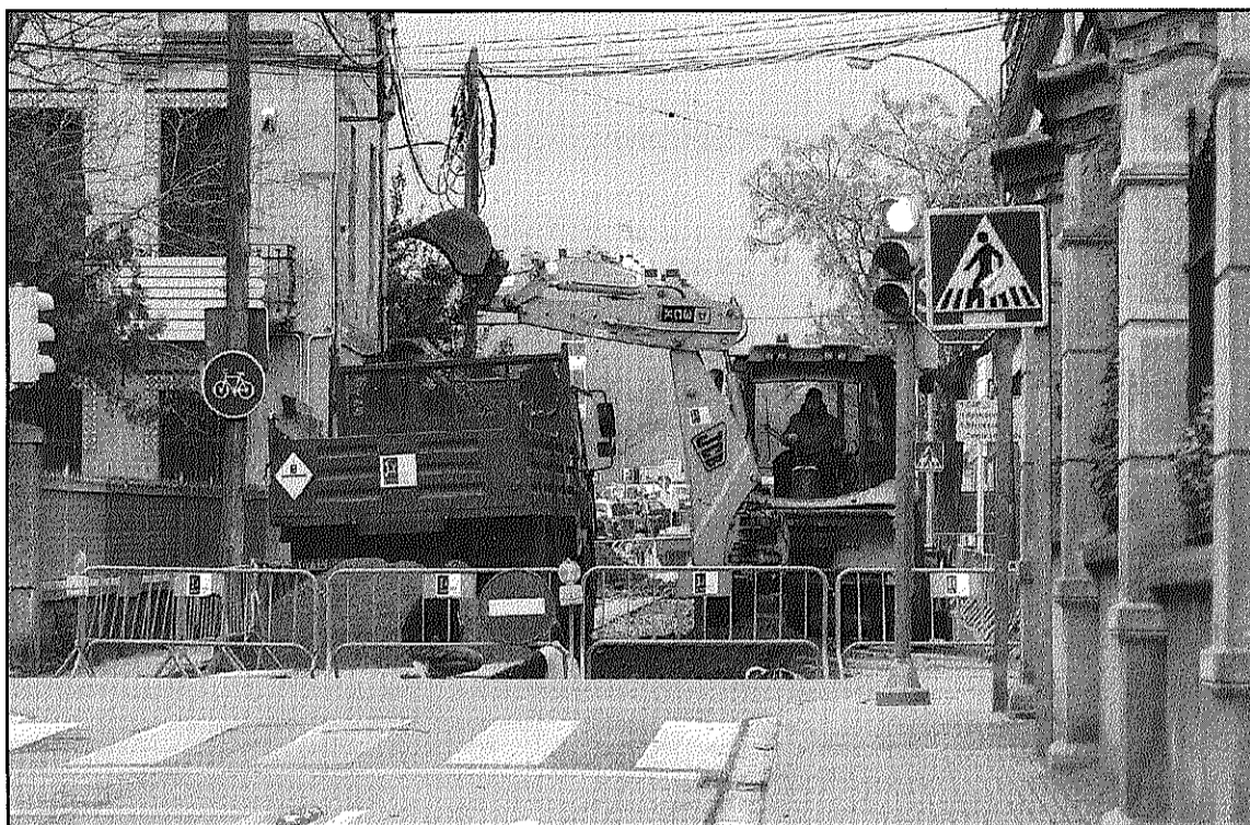
Imatge d'una de les obres que s'estan desenvolupant actualment als carrers de Cardedeu

L'Ajuntament ha demanat als veïns afectats per alguna actuació