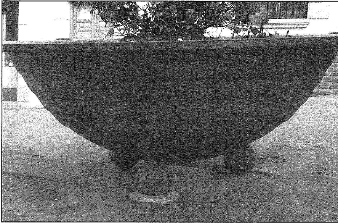
Les jardineres han estat assegurades per evitar possibles accidents als vianants