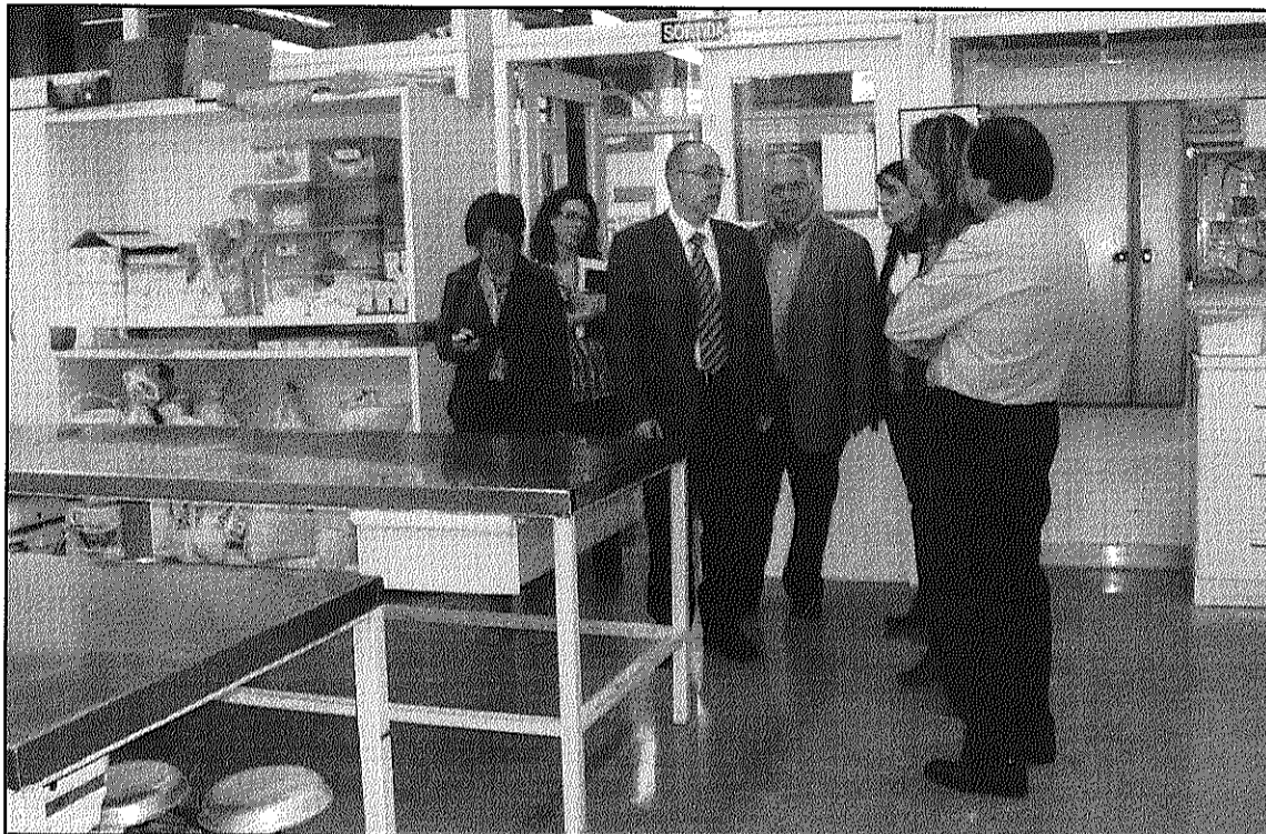
L'alcalde i representants tècnics i polítics del Consistori han visitat exemples de centres

Finalment, els representants del Consistori també s'han interessat per Granollers Mercat, una entitat pública empresarial que té per objectiu contribuir activament al desenvolupament local, pel que fa a l'ocupació de les persones, la