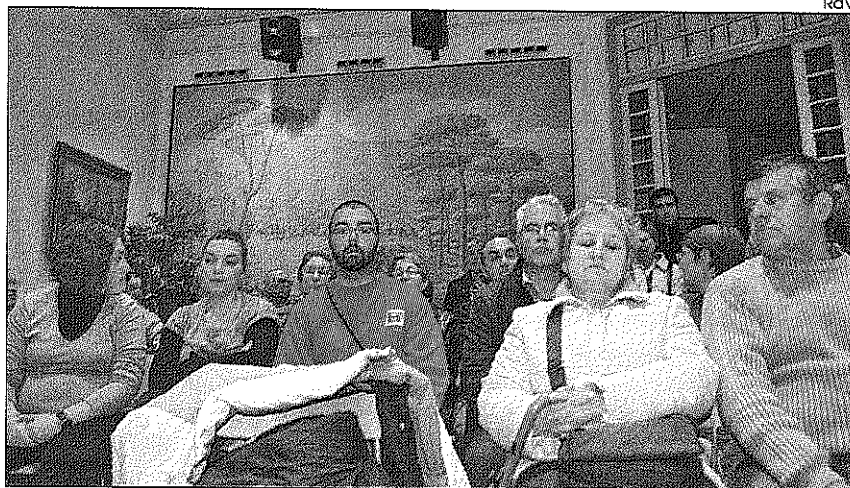
Los vecinos están cansados de las muestras de incivismo.

Los vecinos del barrio Baix Montseny de Sant Celoni han dicho basta y exigen al Ayuntamiento que encuentre soluciones a los problemas de incivismo que aguantan desde hace muchos años todos los fines de semana como consecuencia de la ubicación de la discoteca Quatre en la calle Doctor Barri. Tanto es así, que alrededor de setenta vecinos estuvieron presentes el martes de esta semana en la reunión convocada en el Ayuntamiento para expresar su malestar por la situación que están viviendo "esperamos el viernes y el sábado para descansar y resulta que son los peores días de la semana", aseguraba un vecino. Las principales quejas de los vecinos principalmente están orientadas hacia el ruido de la gente cuando sale del local, los cláxones que suenan con estruendo, los retrovisores y otros desperfectos que se encuentran en los coches que no pueden guardar en los garajes, además de los orines