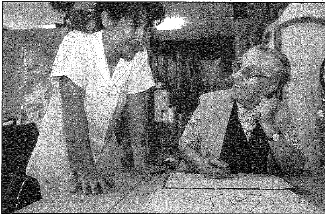
Una de les imatges incloses a la mostra organitzada per Obra Social Caixa Sabadell (L'AdBM)

L'exposició s'estructura en quatre àmbits que conformen una mirada de conjunt sobre la problemàtica que genera la malaltia i convida al visitant a plantejar-se fins a quin punt està preparat per fer un canvi d'aquestes carac-