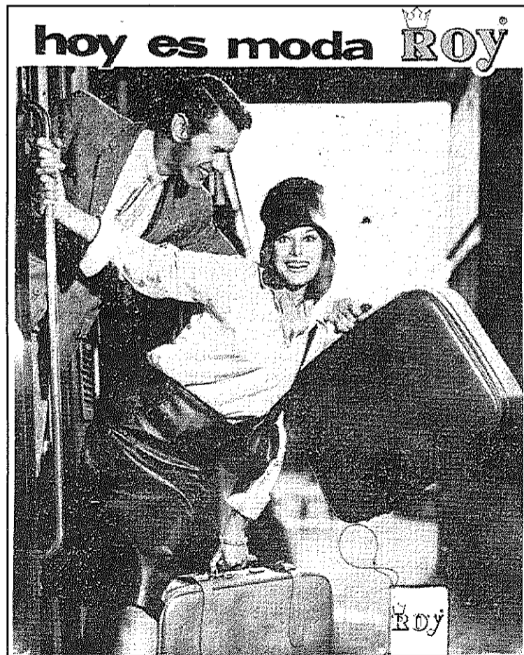
Un cartell publicitari de la marca Roy, de Manhusa (L'AdBM)

A partir de 1959 el poble va començar a canviar ràpidament. Una conseqüència de l'arribada de Manhusa i el seu continuat creixement va ser la forta corrent immigratòria procedent d'Andalusia i Extremadura. Si s'hagués fet un estudi demogràfic a començament dels anys 1970, quan