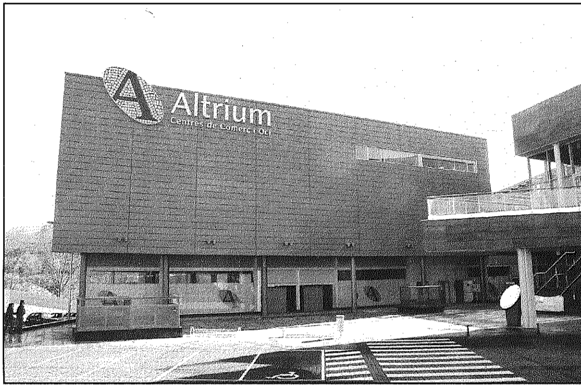
Mercadona és el primer establiment obert a l'Atrium, on té una superfície de 1.300 metres (L'ADBM)

Amb el trasllat a l'Atrium Montseny, Mercadona compta amb gairebé 1.300 metres quadrats de sala de venda, 170 més que a la ubicació anterior, i de 450 places d'aparcament compartides amb el Centre. La companyia d'hipermercats amb seu a València ha assegurat que es referma amb la decisió adoptada de traslladar el seu punt de venda a Sant Celoni a l'Atrium, més després de la gran inversió que va suposar el procés, de l'entorn