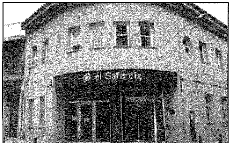
L'Oficina d'Habitatge es troba situada al Safareig (L'ADBM)

REDACCIÓ. Sant Celoni L'Oficina Local d'Habitatge de Sant Celoni facilita, des de la seva convocatòria, la informació i el tràmit dels ajuts personalitzats a l'allotjament per als que ja s'ha obert convocatòria. Aquests, són uns ajuts a fons perdut, personalitzats i assistencials que volen evitar la pèrdua de l'habitatge privat que sigui la residència habitual de la família que demani l'ajuda. Van adreçats a les persones que tinguin rebuts impagats de lloguer o d'amortització del préstec hipotecari, sempre que els seus ingressos mensuals no doblin l'Indicador Públic de Renda d'Efectes Múltiples (IPREM) i que estiguin