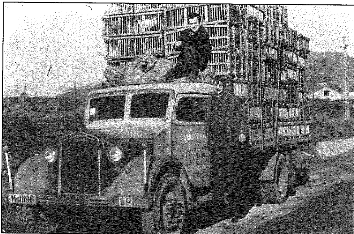
Una de les imatges sobre el treball a Sant Celoni que s'inclou a l'exposició (JOSEP MARIA CORTINA)

Les imatges exposades a la Rectoria permetran, a més, fer un recorregut per la incorporació de la maquinària moderna i el treball en sèrie en els processos productius. La mostra s'estructura temàticament i presenta treballs tradicionals, com les feines de pagès o dones fent la bugada, els oficis vinculats amb l'entorn forestal de Sant Celoni, com el