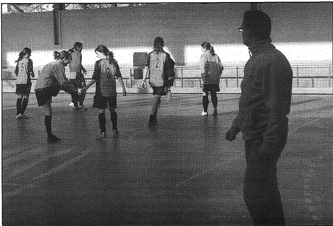
les jugadores del CFFS Vallgorguina en un entrenament