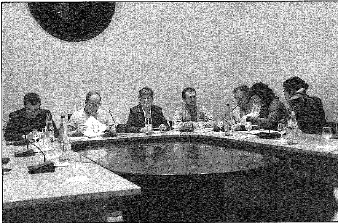
Una imatge del Ple celebrat dijous de la setmana passada a Sant Celoni (L'AdBM)

D'altra banda, totes les formacions polítiques van donar suport també a la modificació puntual del Pla parcial P-7 Plana de la Batllòria, que permetrà la construcció d'un nou pavelló poliesportiu d'ús compartit entre l'escola i els veïns de la població. El nou equipament comptarà amb una superfície construïda d'uns