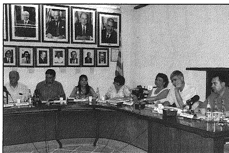
L'equip de govern de Palau, que va aprovar els comptes (AdBM)

L'Entesa d'Arbúcies troba irregular les delegacions d'alcaldia (Pàgina 15)