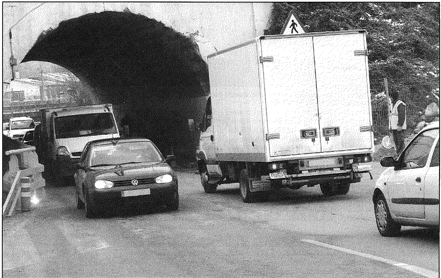
Les obres estan empantenegades des del mes d'octubre per la retirada de l'empresa concessionària Stachys (L'AdBM)

La Generalitat ajorna fins a l'estiu la represa dels treballs per fer el nou accés de sortida del municipi (Pàgina 2)