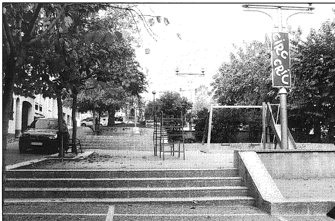
Una empresa pública municipal assumirà el cost de la construcció del nou pàrquing (L'AdBM)

Per àmbits, l'Ajuntament iniciarà, en el camp de l'educació, les obres de condicionament del pati i l'entorn de l'Escola Bressol (115.216 euros) i els treballs de manteniments dels CEIPs Soler de Vilardell (75.400) i Pallerola (72.000). A Cultura, es farà el manteniment dels tancaments exteriors de la Rectoria Vella (8.000), els treballs de condicionament de la sala d'actes de la Biblioteca (50.000) i millores