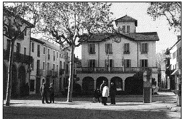
El Ple havia d'aprovar ahir, dijous, el Pla parcial Dr. Klein

El Pla Manent dota Cardedeu de sòl per a equipaments (Pàgina 13)