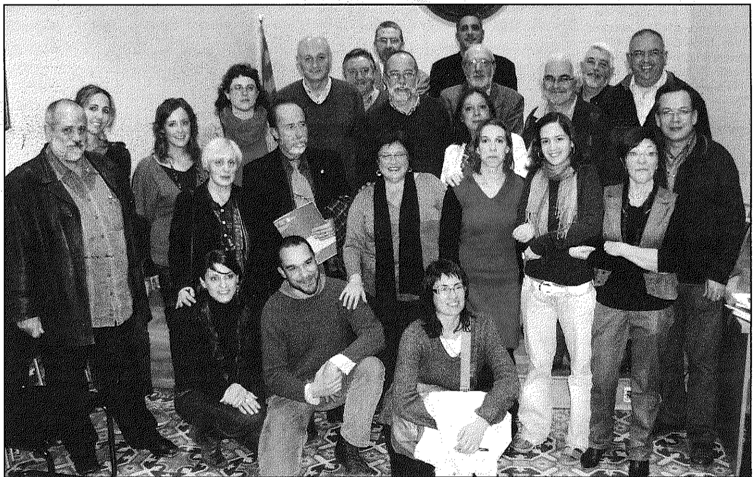
Una imatge dels alcaldes, regidors i tècnics dels dotze ajuntaments del Baix Montseny que van signar dimecres el conveni

Dotze ajuntaments signen el conveni Tritó destinat a la prevenció i tractament de consum de drogues (Pàgina 16)