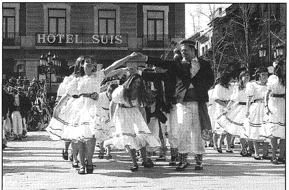
El Ferro va sortir a la plaça comptant amb fins a 85 parelles (L'AdBM)