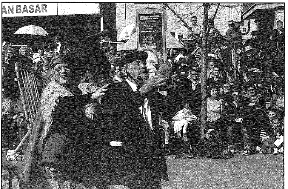
Els diablots van ajudar a la Vella a parir una tortuga al túnel de Dr. Trueta (L'AdBM)