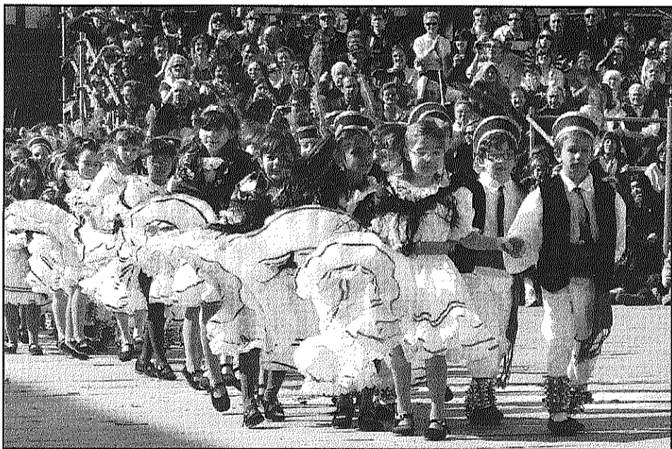
Fins a 71 parelles de la colla del Filferro van participar a aquesta edició

Una escena peculiar va ser la simulació amb tanques del túnel de Dr Trueta de mà dels diablots que, volant en mà, topaven entre ells i creaven un veritable caos embut circulatori. Amb els dolors del part, van intentar traslladar la Vella fins a l'Hospital, quedant encallats a l'interior del túnel on va donar llum a l'animal que simbolitza la lentitud: una tortuga.