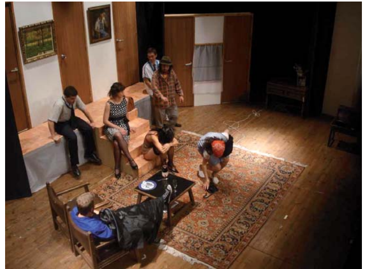
Pel Davant i pel Darrera es va representar els dies 23 i 24 de maig

SANT CELONI.- Més de 1000 persones van omplir la sala gran de l'Ateneu de Sant Celoni, en les dues representacions de Pel Davant i pel darrera que s'han celebrat aquest cap de setmana, amb motiu del 10è aniversari del grup de teatre Tramoia. Les dificultats d'aquesta obra no han estat obstacle per posar en escena una versió adaptada al propi grup que ha pretès ironitzar amb les interioritats de la companyia. Un ritme trepidant i un sentit de l'humor aguditzat, s'han unit al bon treball dels actors i l'equip tècnic per arribar a un públic entregat que al final de les dues representacions allargava els seus aplaudiments.