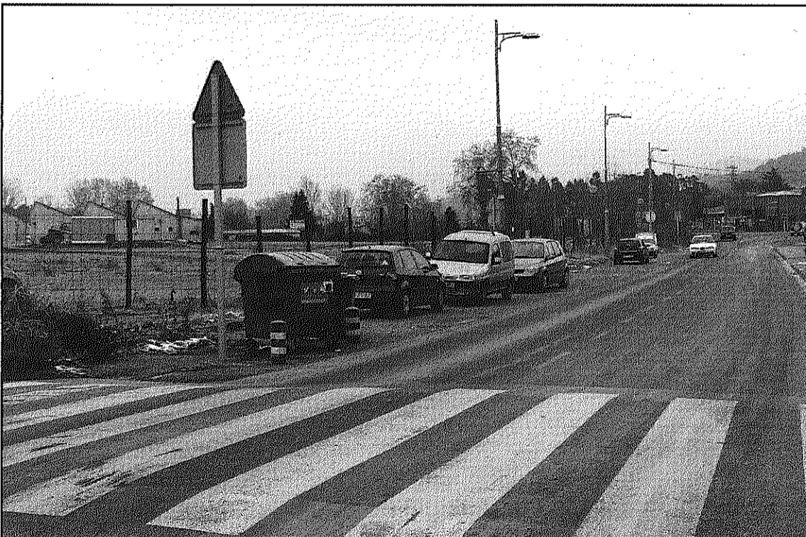
Les aigües brutes de l'extrem occidental del sector es conduiran fins a la depuradora (L'AdBM)

El projecte contempla conduir les aigües sota la C-35 fins a la depuradora