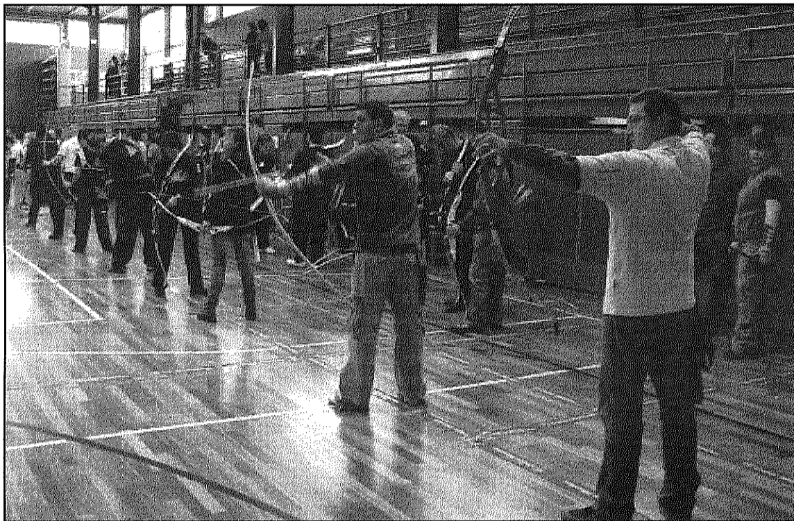
Una imatge d'una tirada en el Trofeu de Festa Major que organitza el club (L'AdBM)

En l'àmbit social, el club va ser present al Parc de Nadal i les Botigues al carrer de Sant Celoni, la Festa Major d'Olzinelles i a les Jornades d'iniciació al tir amb arc organitzades pel Clip. També es van fer tallers didàctics per als socis: un d'emplomallat de fletxes i un altra de confecció de cordes. A això cal sumar un parell d'actuacions inèdites: una celebració d'aniversari a Can Sans i un casament sota el ritual medieval al Pont Trencat. Pel que fa a l'organització de competicions, la