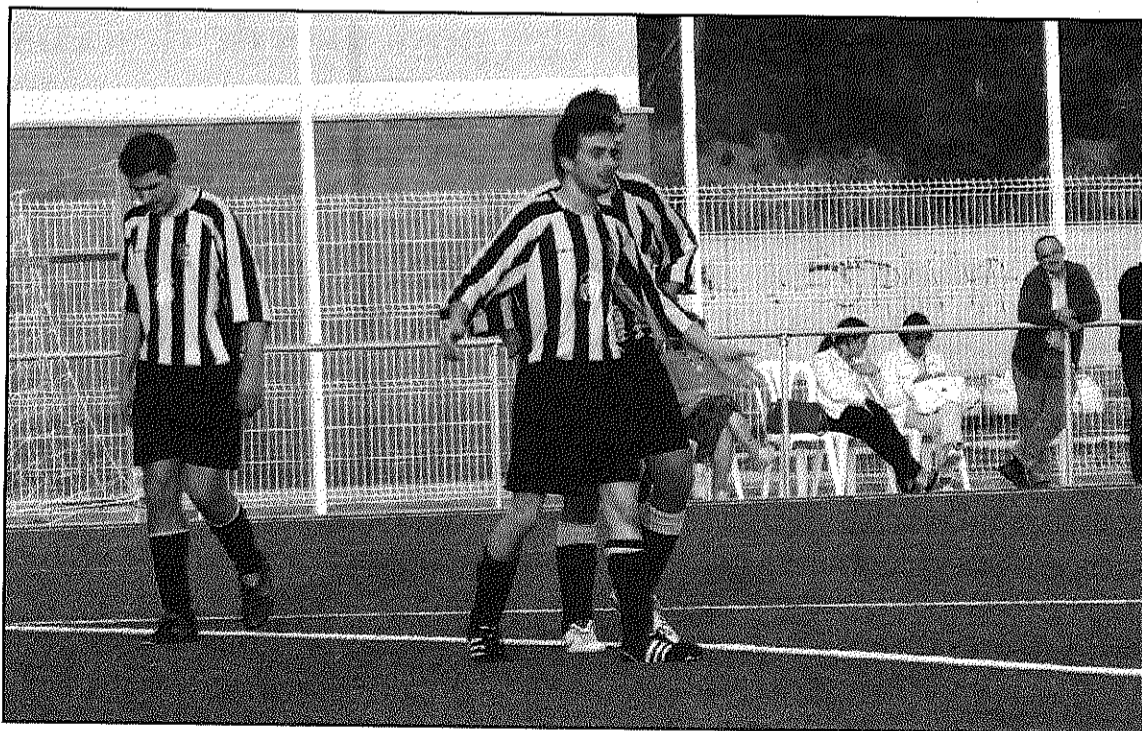
L'Atlètic C Hostalric rep la visita de l'EF Arbucienca en el derbi comarcal (L'AdBM)

Per la seva banda, els d'Hostalric són cinquens després de la victòria de la darrera jornada, en que es van imposar per 3-1 davant la UE Breda B. Els locals necessitaven la victòria per no despenjar-se de les posicions del capdavant de la classificació mentre que el segon equip berdenc segueix tenint molts problemes per puntuar en els seus partits. Aquest dissabte, 14 de febrer, a les 6 de la tarda, tindrà una bona opció per sumar la seva primera victòria amb la visita al camp bredenc del CF Maçanet la Fira. Un rival que encara no ha aconseguit cap victòria en els seus desplaçaments.